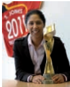
Steffi Jones Präsidentin des Organisationskomitees der FIFA Frauen-WM 2011TM

Darüber hinaus möchte ich allen, die die Veranstaltungen hinter den Kulissen möglich gemacht haben, ganz herzlich danken. Allen Gästen wünsche ich interessante, nachdenkliche und nachhaltige Projektbesuche.