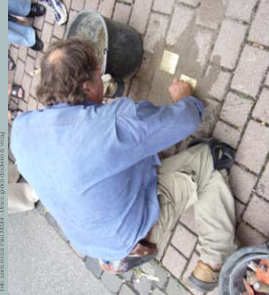
Text: AG Namentliches Gedenken - Layout: G. Schneider