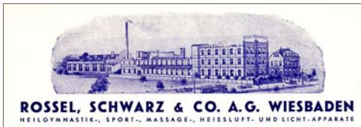
Firmenlogo aus dem Briefkopf der Fa. Rossel, Schwarz Co. AG von 1959