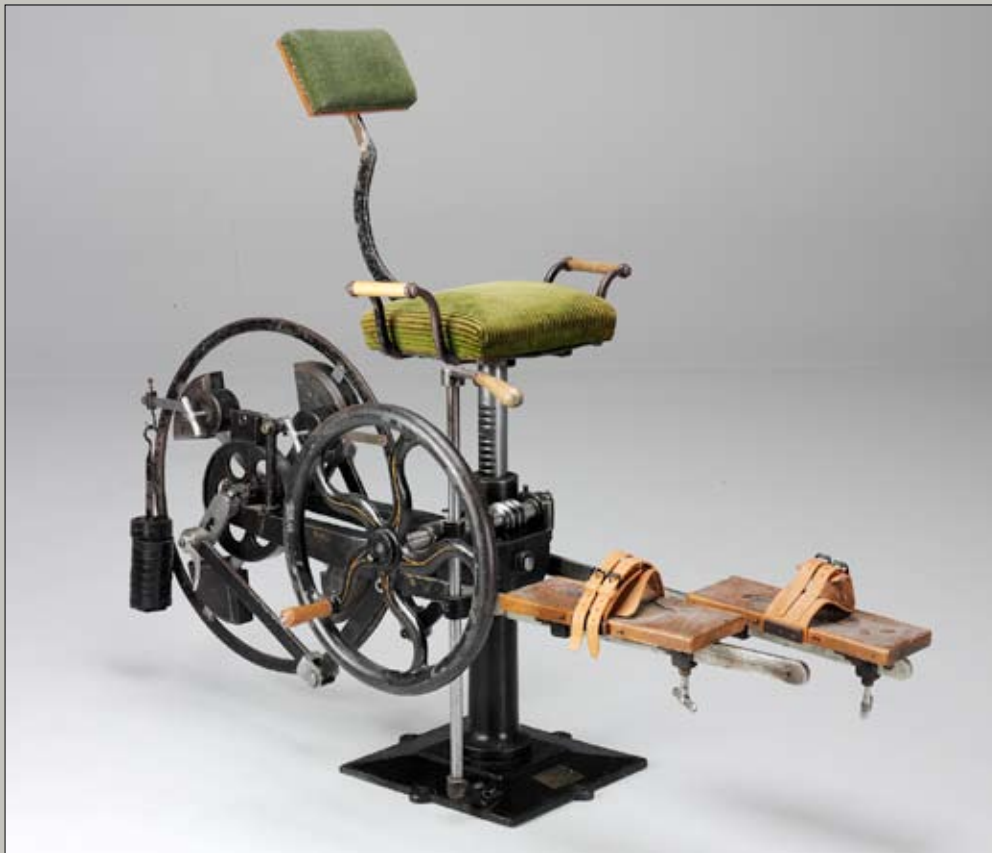
Medico mechanischer Apparat zum Velocipedtreten Wiesbaden Rossel, Schwarz Co. A.G. um 1925

Modell: Medizinhistorisches Museum der Universität Zürich