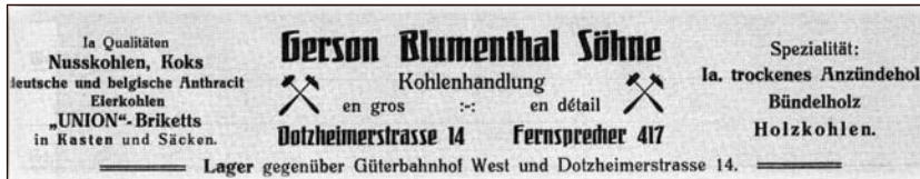
Firmenlogo