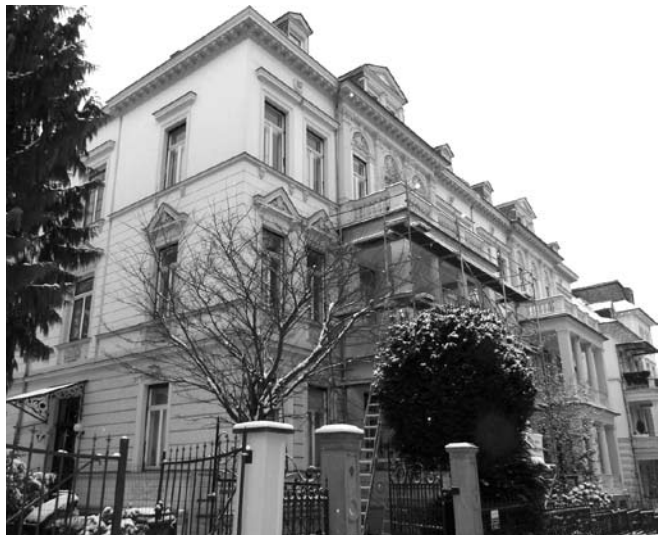
Humboldtstraße 9 heute

Angeblich „auf Anweisung des Gauleiters wegen zunehmender Hetze gegen jüdische Mitbürger“ sei er bedrängt worden, am 09. November 1938 überstürzt die Pfalz zu verlassen. Diese „Ausweisung“ bewahrte ihn wohl vor einer Schutzhaft im Gefolge der Pogromnacht.