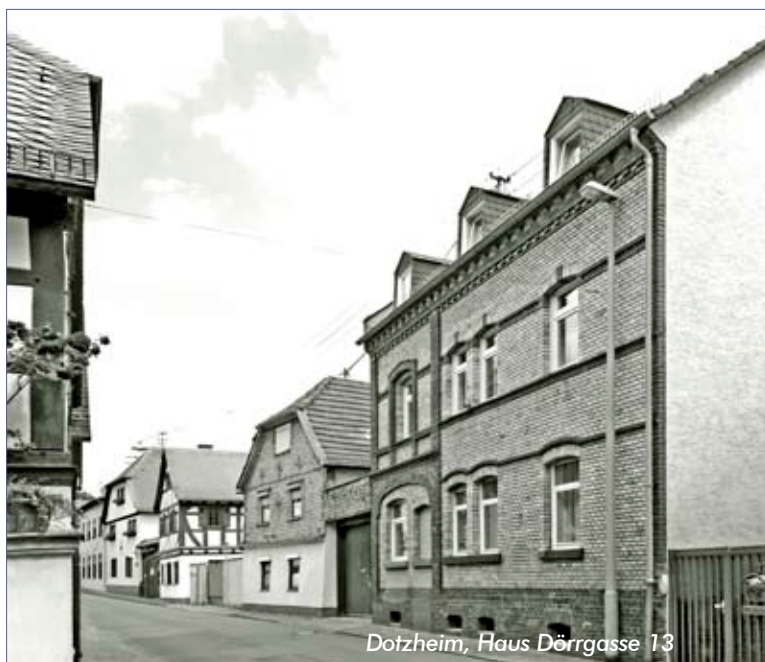
Dotzheim, Haus Dörrgasse 13

Am 10. Juni 1942 werden Mina und Gustav Stein in den Osten deportiert und vermutlich im gleichen Jahr in Sobibór oder Majdanek ermordet. Als fiktives Todesdatum wird der 8. Mai 1945 festgesetzt.