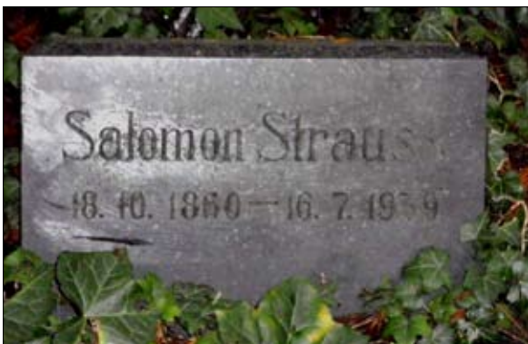
Grabstein für Helenes Ehemann Salomon Strauß Jüdischer Friedhof Wiesbaden Platter Straße