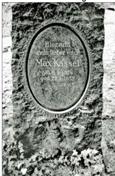
Grab von Max Kassel

An Max Kassel erinnern sein Grabstein auf dem jüdischen Friedhof an der Platter Straße und ein „Stolperstein“ in der Webergasse.